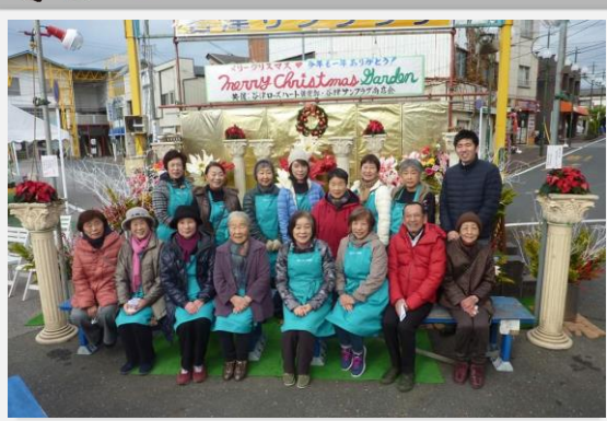
ローズハート倶楽部の皆様と