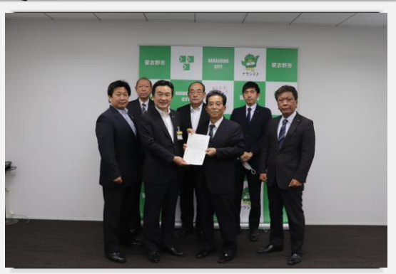
宮本市長に要望書の提出