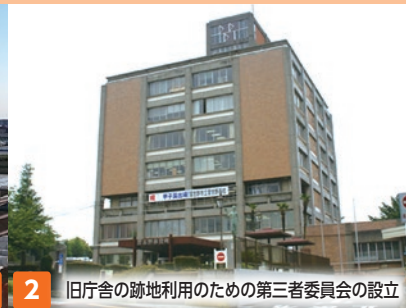
旧庁舎の跡地利用のための第三者委員会の設立