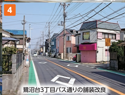
鷺沼台3丁目バス通りの舗装改良