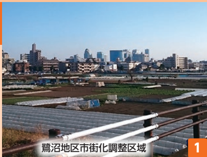
鷺沼地区市街化調整区域